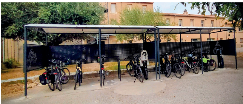
10 PLACES Abri 2360 X 4600 mm