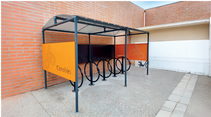
4 PLACES Abri 2360 X 2300 mm